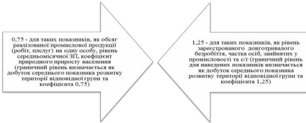
Рис. 1.3. Коефіцієнти визначення граничного рівня відхилення соціально-економічних показників розвитку територій [137]