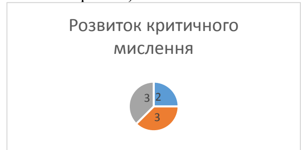
Рис.1. Результати моніторингу листопад 2023р.

критичного мислення. Так, у листопаді 2023 року було проведено моніторинг рівня критичного мислення дошкільників середнього віку (у групах № 4, 8, 10). Результати зазначеного моніторингу відображені на рис. 1.1, де висвітлено рівні сформованості критичного мислення (0-1 – початковий рівень, 1-2 – середній рівень, 2-3 – достатній рівень, 3-4 – високий рівень).