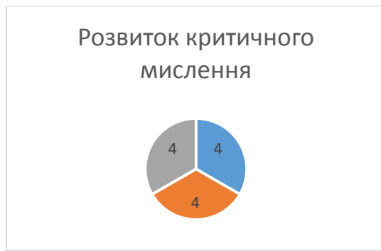
Рис. 1.2. Результати моніторингу березень 2024 р.

За результатами моніторингу рівня критичного мислення було отримано наступні показники: у всіх групах – високий рівень. Це свідчить про доцільність спрямування педагогічної діяльності на розвиток критичного мислення. У вихованців підвищилось вміння виявляти причинно-наслідкові зв'язки, аналізувати інформацію та